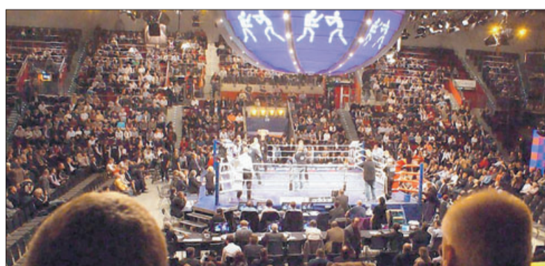
Ein volles Haus, wie hier bei der Box-Gala im Dezember 2009, wünschen sich die neuen Arena-Verantwortlichen der Stadt.

Spec und Roser sehen kein grundsätzliches Problem bei der Vermarktung der Halle. Das Interesse von Künstlern sei da, von den Künstlern sei die Arena gut angenommen, die Akustik gelobt worden. Der Oberbürgermeister führt die Anlaufschwierigkeiten vielmehr auch darauf zurück, dass zum Teil Veranstaltungen nach Stuttgart gingen und dass die alte Betriebsgesellschaft zu hohe Personalkosten