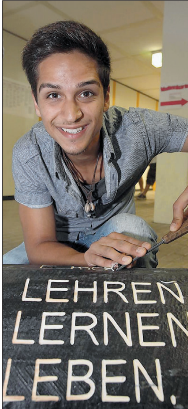
„Lehren, lernen, leben“ – unter diesem Motto stehen die Tage der offenen Tür im Beruflichen Schulzentrum Bietigheim-Bissingen. Zum Auftakt verfolgten zahlreiche junge Leute den Auftritt der Lehrband. Aber auch Präsentationen wie die eines angehenden Schlossers stießen auf großes Interesse.

Nach dem ersten offiziellen Rundgang durchs gut besuchte Gebäude war Schulleiter Ranzinger sichtlich erleichtert. Alles hatte geklappt, alle waren begeistert, in sämtlichen Gängen wuselte es, überall Musik, Theater, kunterbunte Ballons, Bewirtung, angeregte Gespräche. Eine Mammutveranstaltung, die von langer Hand geplant gewesen war. Vor zwei Jahren habe man die Entscheidung getroffen, dass das Jubiläum angemessen gefeiert werden sollte, und zum Ende hin sei er schon angespannt gewesen, da es immerhin darum gegangen war, 70 Projekte